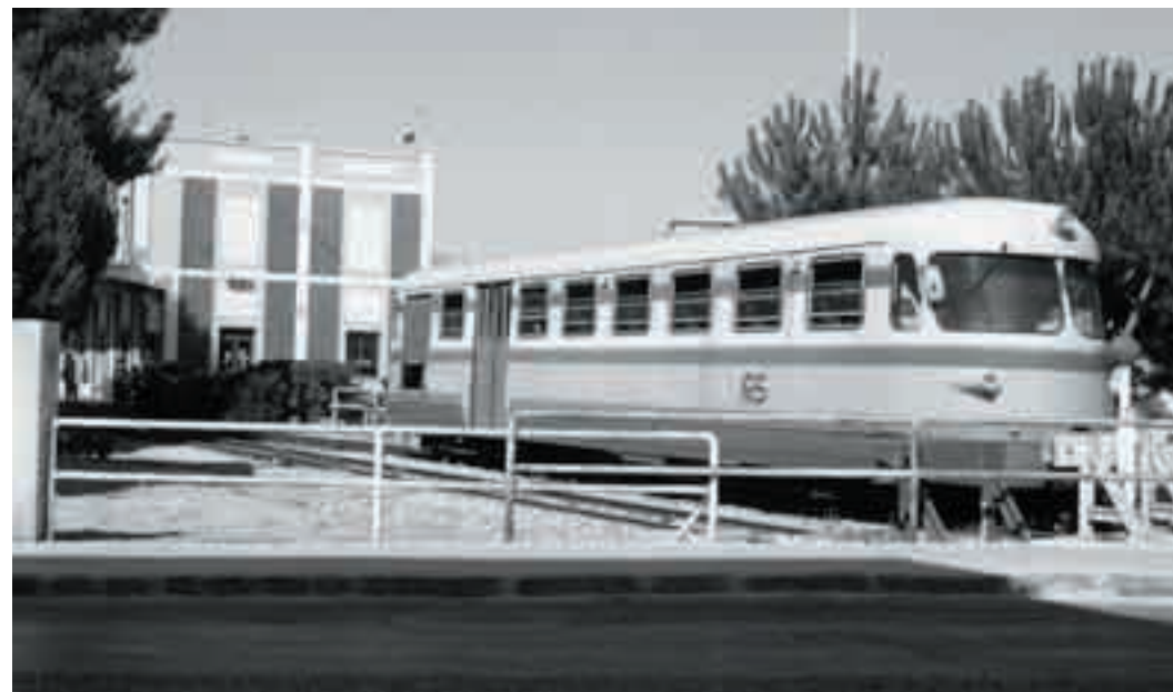
La stazione ferroviaria di Alghero

Nel «nodo metropolitano urbano» Sassari-Alghero-Porto Torres, l'offerta di trasporto collettivo per i circa 300 mila residenti si basa su linee ferroviarie costruite alla fine dell'800 (Sassari-Alghero, Sassari-Sorso e Sassari-Porto Torres) e su una rete stradale non adatta ad accogliere i milioni di autoveicoli transitanti in un anno ed in parecchi tratti estremamente pericolosa.