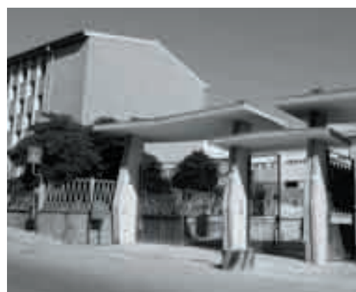
L'ingresso della casa serena di Alghero

Si dice del caldo di questi giorni che è insopportabile; e lo si dice il più delle volte solo per dire. Ma l'afa, il caldo umido per qualcuno è veramente insopportabile: gli ospiti della casa di riposo Serena ad Alghero combattono con questo clima opprimente che non da soste. Per non parlare dei non autosufficienti ricoverati nelle infermerie del pensionato algherese. Esiste l'aria condizionata, replicherà facilmente qualcuno. Si esiste, ma solo negli uffici dei servizi sociali attigui alla struttura, dieci passi lungo i corridoi che conducono ai reparti degli ospiti e l'unico refrigerio è quello dei pochi ventilatori mobili in dotazione o di quelli che pendono dai soffitti delle sole camere delle infermerie. Un rimedio quello del ventilatore che rischia di essere peggiore del male, provocando il raffreddamento dei degenti non autosufficienti. Le notti di non pochi degli anziani ospiti sono quasi insonni, in ogni caso tormentate, ed è ovvio che sottrargli ore di riposo significa indebolirli, fiaccarli inutilmente. Nelle notti sudate qualcuno avrebbe cercato sollievo sdraiandosi sull'impiantito,